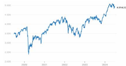
Euro Stoxx 50