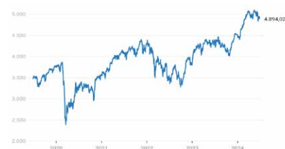
Euro Stoxx 50